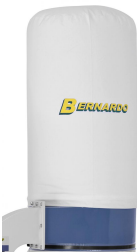
Geringer Staubdurchlass durch gewebten Fein-Filtersack