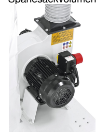
Leistungsstarker Aluminium-Motor, besonders laufruhig