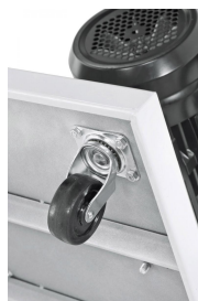
Fahreinrichtung mit Lenkrollen serienmäßig