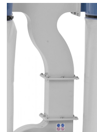
Erhöhte Ausführung = mehr Spänesackvolumen