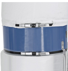
Spanngurt mit Schnellklemmung zum einfachen Wechseln des Spänesackes