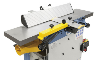
Der massive, bis 45° schrägstellbare Abrichtanschlag mit Prismenführung ist leicht verstellbar