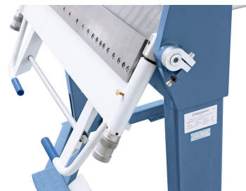
Die großdimensionierte Führung der Biegewange sorgt für ein präzises Arbeiten.