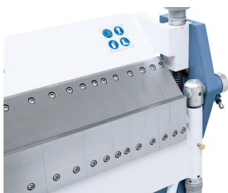
Segmentierte Ober- und Biegewange für eine große Anzahl von Biegemöglichkeiten.