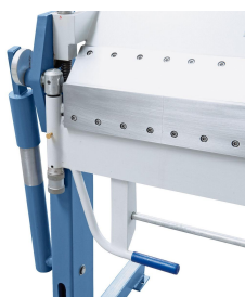
Ein Hilfszylinder unterstützt den Biegevorgang beim Abkanten.